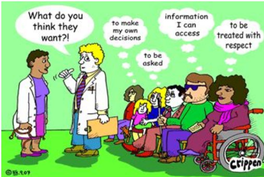
Bild: crippencartoons.com. Zwei Ärzte stehen vor einer Stuhltreife mit Menschen mit Behinderungen und reden über Sie. Der Arzt fragt die Andere Ärztin: "was meinst du, was wollen die?" Die Menschen mit Behinderungen haben Gedankenblasen: "Meine eigenen Entscheidungen treffen", "gefragt werden", "Informationen die für mich zugänglich sind", "mit Respekt behandelt werden".

Diskriminierung von Menschen mit Behinderungen