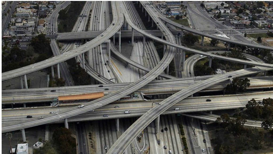
Eine große Autobahnkreuzung mit verschiedenen Ebenen

Überschneidung und Wechselwirkung von verschiedenen Diskriminierungsformen in einer Person