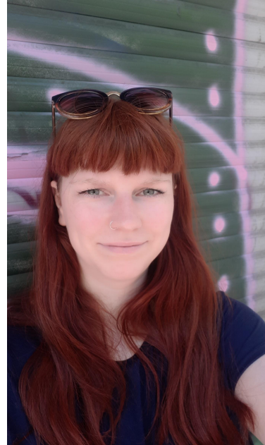
Bild: junge weiße Frau, rotes schulterlanges Haar mit einem Pony